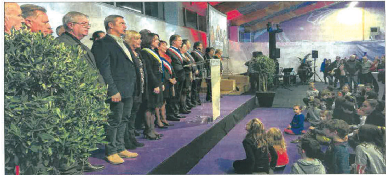
À la fin de la cérémonie, les élus et le public ont chanté "la Marseillaise" avant de partager le verre de l'amitié.