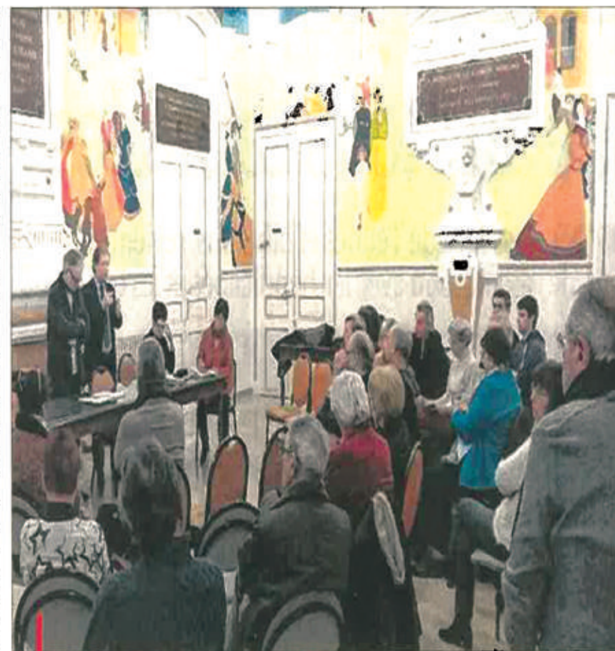
Le débat public s'est déroulé dans le calme. Les organisateurs ont salué la présence des participants et surtout l'écoute bienveillante et respectueuse qu'ils ont eue les uns envers les autres.

Concernant le premier thème, le public s'est accordé "à pointer les difficultés d'une transition écologique qui constitue un problème mondial, pour lequel tous les pays devraient réfléchir ensemble pour trouver