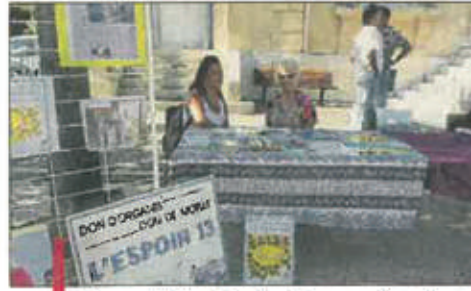
L'association Espoir 13 sera présente au Forum des associations.

Les Cadolivains pourront ainsi renouveler leurs inscriptions ou découvrir une nouvelle passion qu'ils pourront exercer tout au long de l'année, dans leur village.