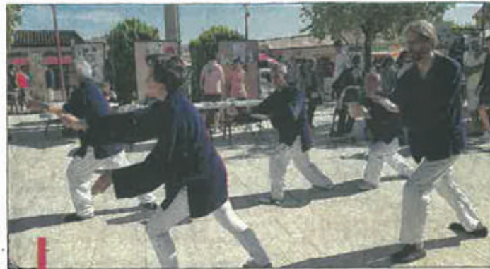
Les démonstrations de tai-chi sont toujours très appréciées lors de cette manifestation.

Le tissu associatif à Cadolive est riche d'une cinquantaine d'associations couvrant tous les secteurs : danse, tennis, judo, gymnastique, football, handball, basket-ball, tai-chi-chuan, vo kung-fu, yago yoga, self-défense, chasse, art et culture, peinture, art-thérapie et bien-être, club de lecture, loisirs créatifs, sophrologie, don du sang, Espoir 13, chorale, philharmonique, AIL. C'est sous un beau soleil qu'elles ont tenu leur forum annuel samedi, sur la place de la mairie. Pour cette édition 2018, trois nouvelles associations étaient présentes : l'association catholique "Saint Lazare", l'association musicale "Grains de rythmes" et "La Cabane aux cobains", montée par