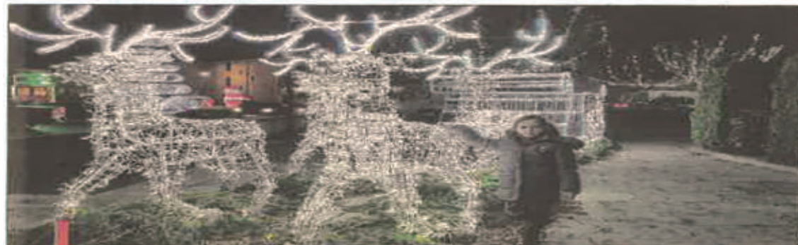
Des illuminations, une crèche et un marché de Noël sont programmés dimanche.