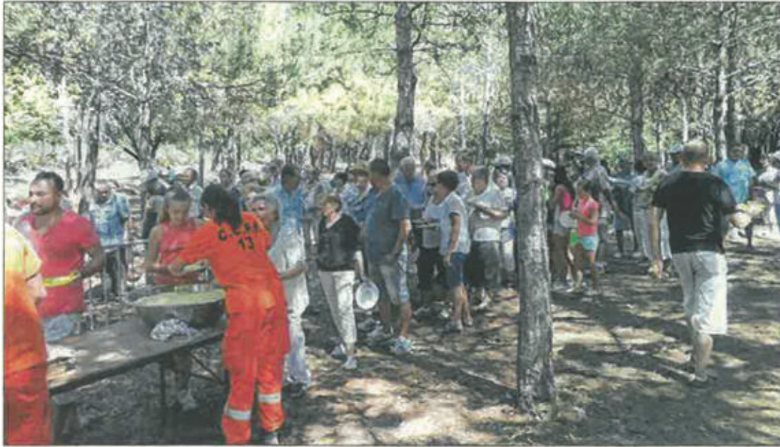
Le repas champêtre de la Sarriée attire toujours un très nombre de convives.

Au programme de la journée, après le déjeuner, vélo, pétanque, badminton, et bien