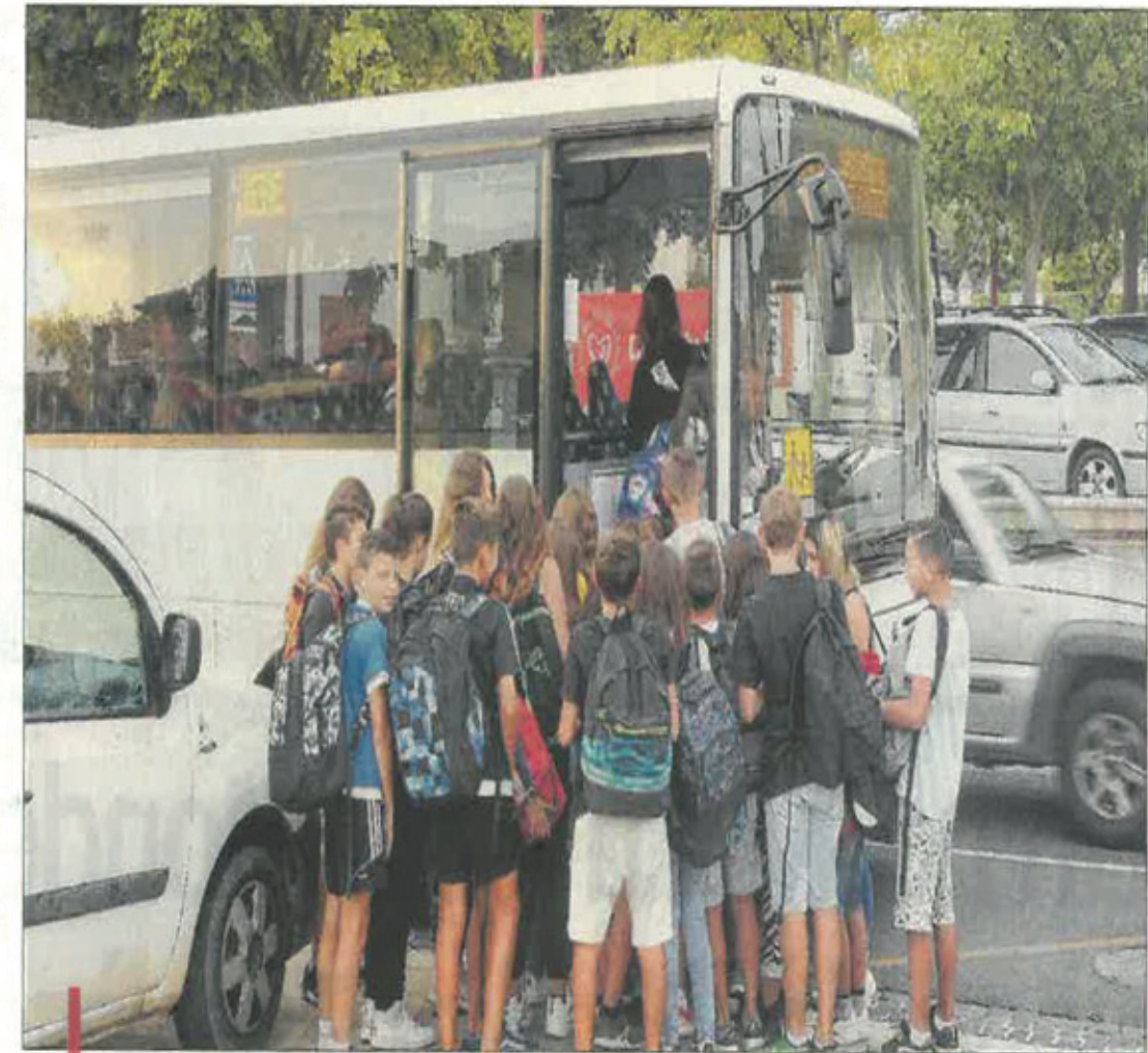
Collégiens et lycéens qui doivent se rendre à Aix, Marseille ou Gardanne vont bénéficier des transports scolaires gratuits.