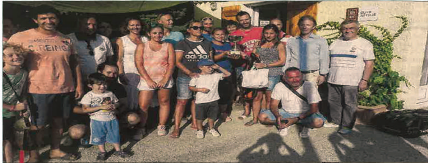
Ce trophée était également l'occasion de faire découvrir de nouveaux courts aux licenciés.

La 2 e édition du Trophée de l'Étoile s'est déroulée sur les 4 nouveaux courts de tennis de Saint-Savournin, à l'initiative des bénévoles du Tennis Club de Cadolive, Mimet et Saint-Savournin. Ce trophée a pour objectif de récompenser les plus beaux parcours des joueuses et joueurs des trois clubs en 4 e et 3 e série et de faire découvrir ces tournois à tous les licenciés FFT (Fédération Française de Tennis) qui aiment pratiquer la compétition dans une ambiance amicale et conviviale.