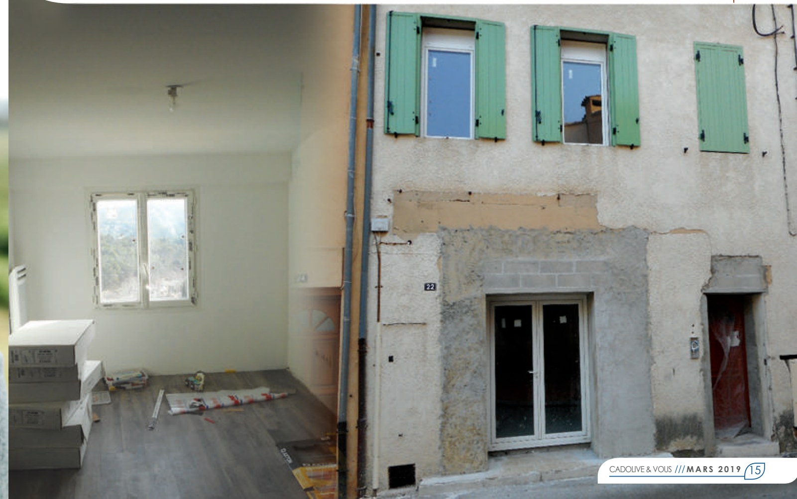
Rénovation de l'ancienne boucherie

“ Avec discrétion et constance, notre village agit et progresse, illustrant là encore sa volonté concrète et sans faille de bien vivre ensemble. ”