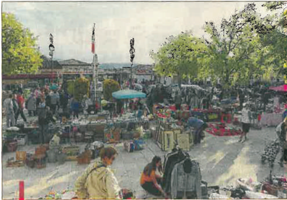
Des milliers d'objets en tout genre vont changer de main, dimanche, au profit des enfants de la commune.

Comme d'habitude, ce sont les collectionneurs qui vont se presser, dès le début de la manifestation très tôt le matin, pour dénicher les meilleures affaires, avant de laisser la place, un peu plus tard dans la journée, aux badauds qui viendront, souvent en famille, flâner, chiner, comparer ou acheter sur un