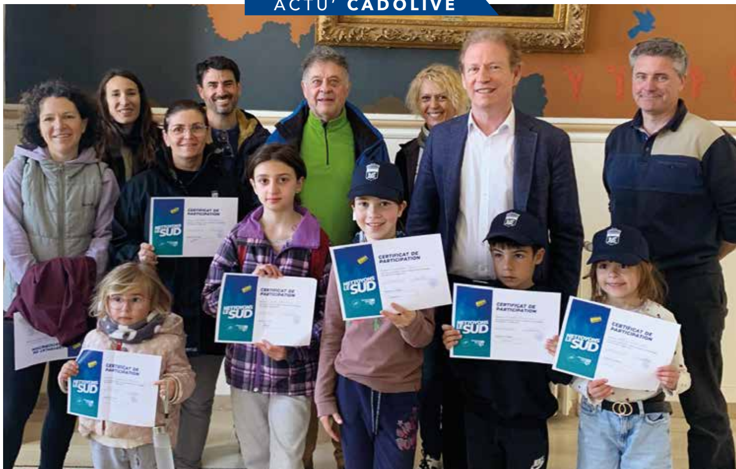
Le Maire a remis les diplômes aux jeunes participants.