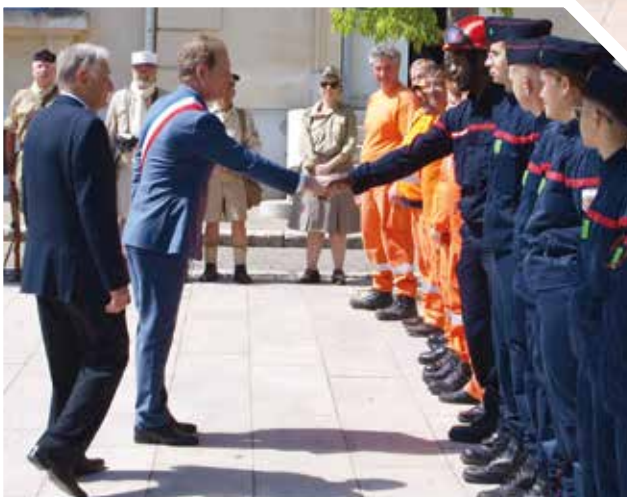
Les soldats d'Antan, le CCFF, les pompiers de Mimet.