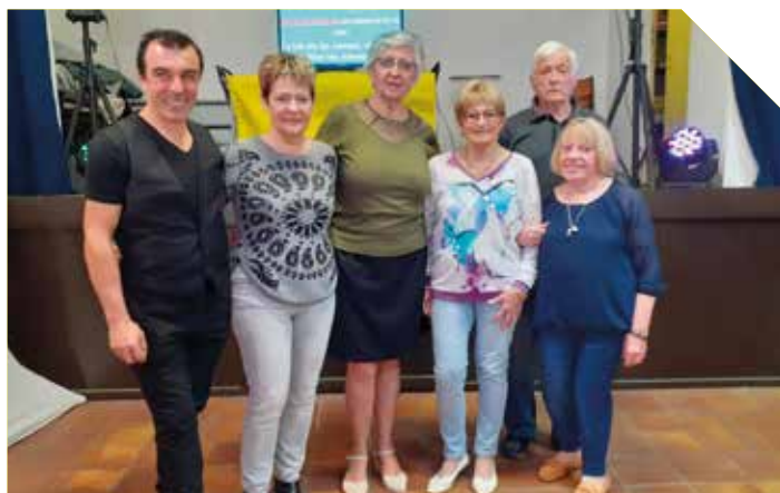
Les membres du bureau de l'ENTRAIDE de CADOLIVE et l'animateur.