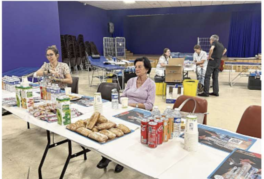
Cadolive organise régulièrement des campagnes de collecte de sang.

Lors de celle du 1 er juin dernier dans le village, 42 personnes, dont quatre pour qui c'était la première fois, ont répondu présents à cette action solidaire du don de sang. Et, "comme chaque année, que ce soit localement ou à travers le pays, les besoins sont importants" confesse un membre de l'association des donneurs de sang de Cadolive. Et pour cause, les transfusions sanguines sauvent des millions de vies chaque année et jouent un rôle essentiel lors des interventions d'urgence ou en cas de catastrophe. L'Établissement français du sang (EFS) compte plus de deux millions de donneurs. Pour être éligible, il faut avoir entre 18 et 70 ans révolu et pe-